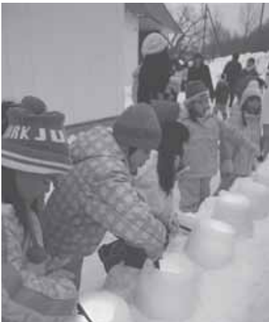
2/5(金) ふれアイス in 清田