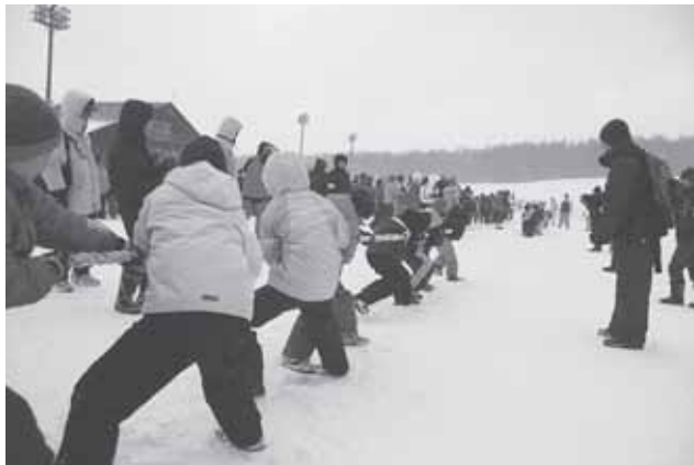
2/7(日) 白旗山ウィンタースポーツトライアル