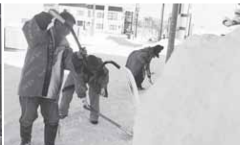
2/13(土) 除雪ボランティア