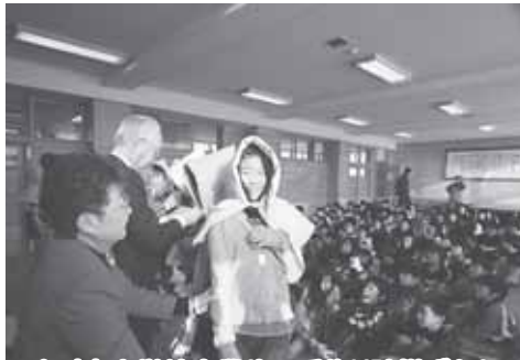
2/4(木) 小学校卒業生へ手作り防災ずきん