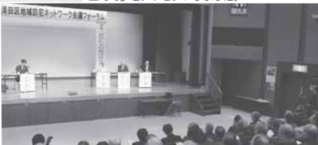
2/1(月) 清田区地域防犯ネットワーク会議フォーラム