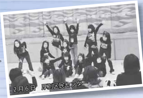
2月6日 厚別区民センター

ここにステージでは、子どもたちがダンスを披露。とびっきりの笑顔がはじけ、大いに盛り上がりました。