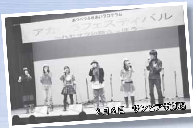
2月6日 サンピアザ劇場

主に道内で活躍している33組のアカペラグループが、見事なハーモニーを披露。冬の新さっぽろに温かな歌声が響き渡りました。