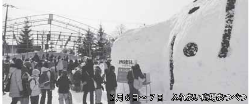
2月6日～7日 ふれあい広場あつべつ