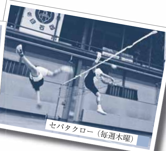
セパタクロー (毎週木曜)