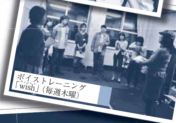
ボイストレーニング「wish」(毎週木曜)