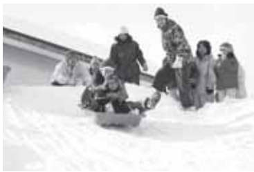
▲地域の子どもがたくさん参加する雪まつり。今年はこちらも遊びに来ました。