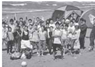
▲DONUTSメンバーキャンプ（あそび～ち石狩にて）

ポプラは、活動を通じて自然と仲間が増えていく場所でもあります。大半が「スポーツをしたい」などのきっかけでポプラを初めて知ることになります。サークルに何度か足を運ぶとあることに気付きます。 それは自分のサークルの仲間がほかのサークルの人たちと非常に仲が良いことです。実はポプラでは行事企画などで自分のサークル以外の人たちとかかわる機会が非常に多いのです。行事が終わっても一度できたつながりは消えず、つながる一方なので、年単位で活動 ポプラの中だけではなく、ほかのレッツを利用する人とも、競技や各館のDONUTSの輪を通して、仲間はさらに増え続けます。友達100人なんて簡単にできちゃいますよ。