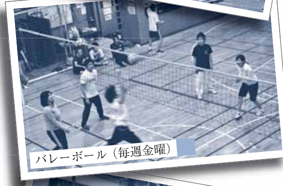
バレーボール（毎週金曜）