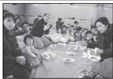
▲子ども雪まつり～昼食の様子～