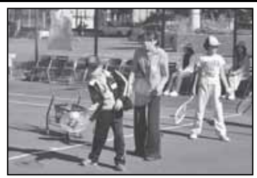
▲ちびっこテニス交流会