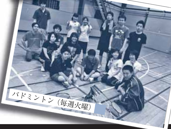
バドミントン（毎週火曜）