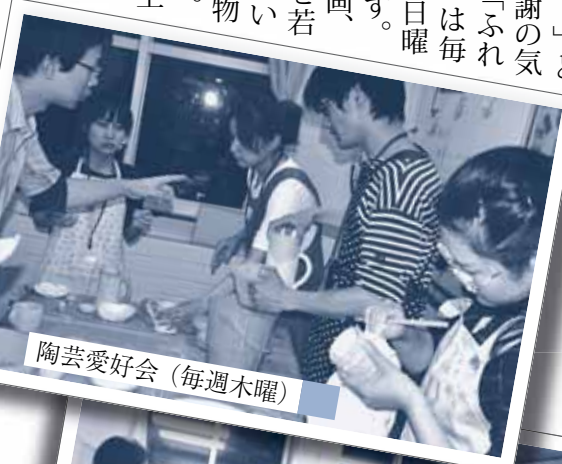
陶芸愛好会 (毎週木曜)