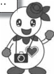
マスコットキャラクター「しろっぴー」

「しろいな風景」では、区内で撮影した風景写真を募集しています。募集要項は区総務企画課広聴係と区内各まちづくりセンターで配布しているほか、区公式ホームページに掲載していますので、内容を確認の上、ご応募ください。