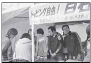
▲白石区ふるさとまつりに出店