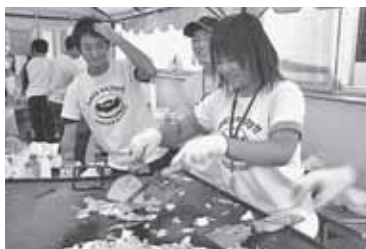
▲若者たちが手作りで開催するお祭り。地域の皆さんの笑顔がみんなの元気の源。

「日ごろお世話になつてい地域の方に向けて何か恩返しをしたい!」という地域への感謝の気持ちから原動力。「ふれあいポプラ祭」は毎年9月、最初の日曜に開催しています。準備から企画、運営まで全てを若者たちが行っている。その品物は全て格安です。毎年千人以上