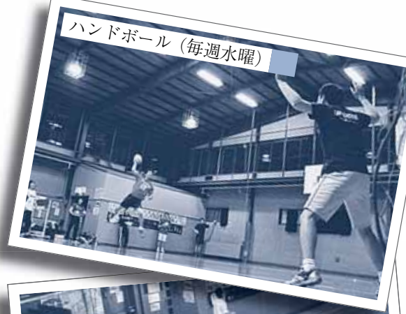
ハンドボール（毎週水曜）

同じ趣味や興味を持った同年代の人たちとの活動を通して仲間の輪を広げることができる場所です。