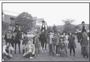
▲浦河町での交流会