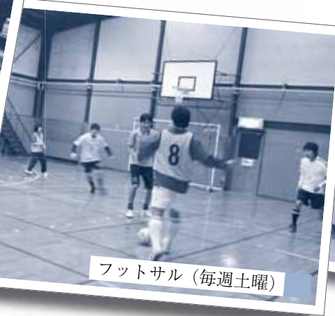
フットサル (毎週土曜)