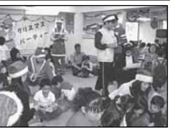
▲地域の方とクリスマスパーティーを開催