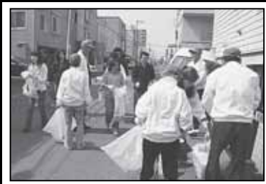
▲地域の方と町内清掃