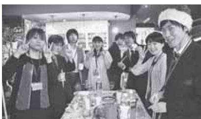
▲クリスマス会「キラッと☆クリスマス」