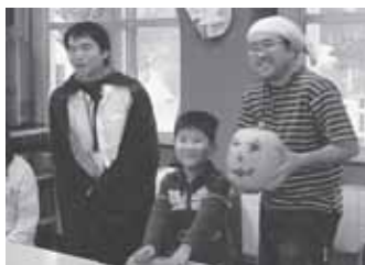
▲ハロウィーン「ジャック・オー・ランタンをつくろう」