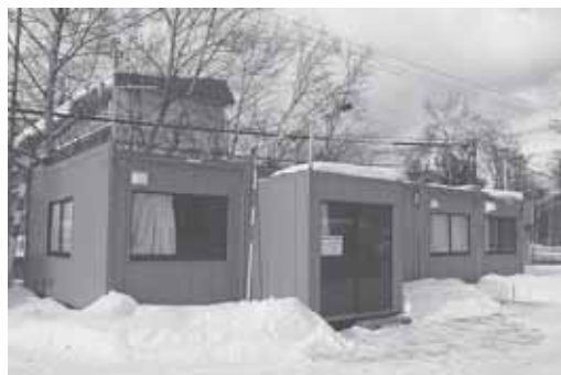
▲除雪センター外観

複数の除雪事業者が連携して、除雪作業の問い合わせの対応や道路の除雪、凍結防止剤散布などを実施しています。これによって、地域の道路状況