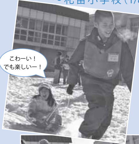
こわーい！でも楽しいー！

寒さにも負けず、子どもたちは元気いっぱいです！学校のグラウンドでそり遊びや雪中かるたなど、雪国ならではの遊びをたっぷり楽しみました。