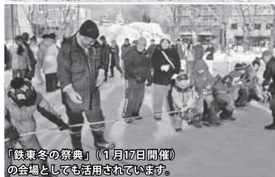
「鉄東冬の祭典」（1月17日開催）の会場としても活用されています。