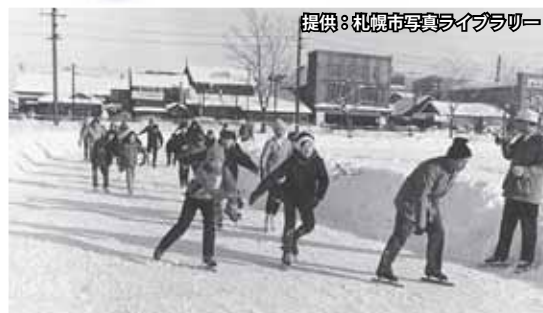
昭和43年に撮影されたリンクの様子。