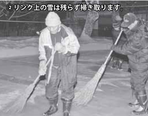
②リンク上の雪は残らず掃き取ります。