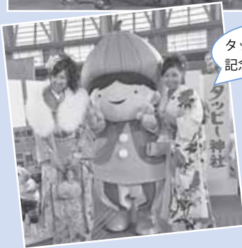
タッピーと一緒に記念撮影♪