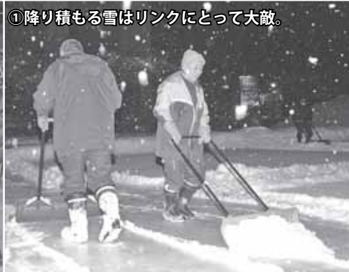
①降り積もる雪はリンクにとって大敵。