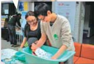
▲人形でお風呂に入れる練習！

マタニティ教室で妊娠中の過ごし方や、出産に当たっての心構え、育児方法を学びましょう！お父さんも一緒に参加できる両親教室もあります。