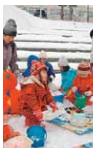
雪ままごとの様子

◆子育て講座「ママたちのお しゃべりタイム」 自由におしゃべりしながら リフレッシュしましょう。 日時 2月16日(火)、18日(木)の 全2回。いずれも午後2時~ 3時30分。 場所 区役所C会議室(前田 1条11丁目)。 対象 0歳から就学前までの 乳幼児を育てている保護者。 ※希望者には託児を行います。 定員 先着10人。 申込 1月26日(火)午前9時か ら電話で申し込み。 申込先・詳細 健康・子ども課 子育て支援係 ☎(681)2400 内線551