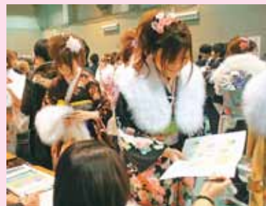
▲昨年度、絵を返却したときの模様