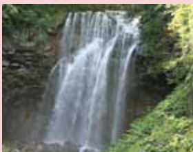
「日本の滝百選」にも選ばれました