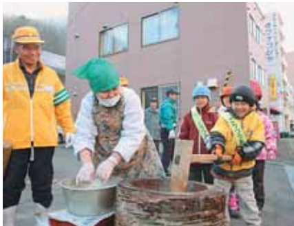
▲掛け声に合わせて「べったん！べったん！」