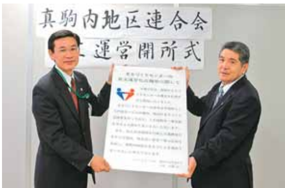
▲地域住民による市民自治の新たな一歩！

真駒内まちづくりセンターで、地域住民による自主運営がスタートしました。「真駒内地区連合会」が運営主体となり、まちづくりの拠点として、より一層地域に根ざした取り組みを進めていきます。