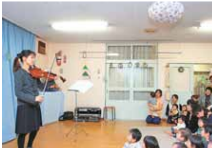
▲聞いたことある曲かな？