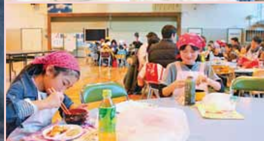
▲豊滝小学校の児童全員でおもちつきをしました！

あけましておめでとうございます。 本年も、皆さまと共に、区民一人一人が 主役のまちづくりを目指して、職員一同取 り組んでまいります。 今後とも皆様の変わらぬご支援をお願い 申し上げます。