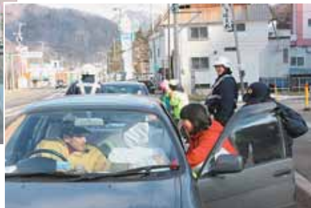
▼安全運転をお願いします！

定山溪交番前の国道230号沿線で、地域住民や定山溪小学校、定山溪保育所の子どもたちが交通安全を呼び掛け、道行く車に信号機をイメージして作った3色の「無事故もち」を配布しました。交番前ではもちつきも行われ、つきたての「無事故もち」が参加者に振る舞われました。