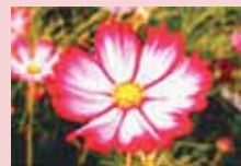
あきざくら 秋桜ともいいます