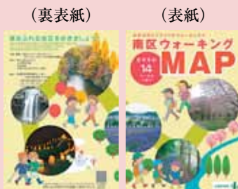
自然豊かな南区を歩きましょう