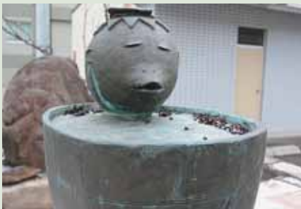
▲「イユダナ」阿部典英 作

定山溪温泉には「かっぱ淵」の由来となった「かっぱ伝説」があり、昭和四十年、札幌出身の漫画家おお比呂司さんの助言がきっかけで「かっぱ」をシンボルとした街づくりが行われてきました。平成三年には札