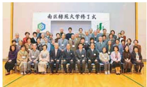
▲これからも、仲間と共に学び続けます！

南区民センターで、南区緑苑大学（高齢者教室）の修了式が行われました。第36期生49人が修了証書を手にし、半年間共に学んだ仲間たちとの大学生活を振り返っていました。修了生の多くはOB会に参加し、これからも交流を深めていきます。