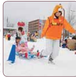
▼昨年のそり引きの様子

そり引き・的あて・色雪遊びなどの遊びを通して、地域の皆さんがふれあうお祭りです。室内では地域主催の子育てサロンも開催します。