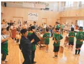
▲つながるフェスタ

同センターの運営に地域住民の声を生かそうと委員会を設立しました。「つながるフェスタ」などのお祭り、地域でまちづくりを考える会などを同センターと共催。地域住民が集う場として定着してきています。