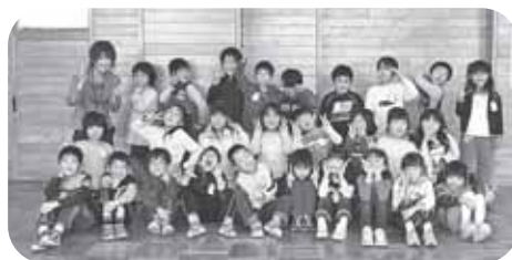
ねんくみ ともだち せんせい 1年2組のお友達と先生

おしょうがつをイメージして、ペンでおともだちをかきました。てやあし、かおを、ペンでかくのがとてもたのしかったです。クレヨンでえをかいたりすることもすきだけど、ペンはいろをぬるとはっきりするので、おもしろいです。またペンでおともだちをつくりたいです。