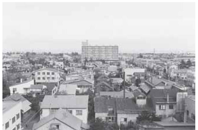
▲昭和47年、開設当初の西区役所屋上から、現在の地下鉄琴似駅方向を望む。見晴らしのよい景色が続く。