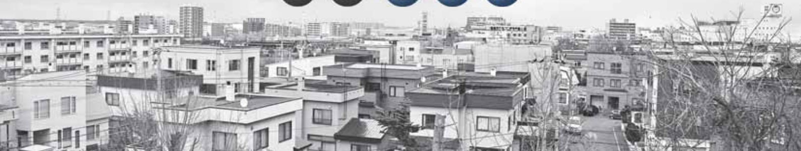
▲ (上) 昭和52年、高台に位置する手稲宮丘小学校（宮の沢3条2丁目）付近から、札幌自動車道と宮の沢地域の市街地を望む。 (下) 現在の様子。高層建築物をはじめとした建物の密集度が大幅に増している。