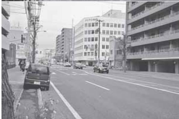
▲（上）昭和44年、山の手3条1丁目から北5条手稲通を撮影。 （下）現在の様子。高いビルが林立し、景色は一変した。