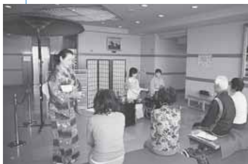
▲はっさむ地区センターの茶席