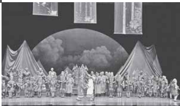
■今年10月の東京公演の様子。細川さんも驚くほどの出来栄で、皇后さまからは温かい拍手が送られました。

※入場は無料で整理券が必要。希望する方は同会事務局(Tel.661-2111)へお問い合わせください。