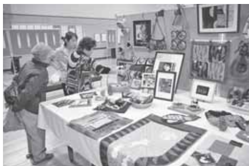
▲西野地区センターの作品展示