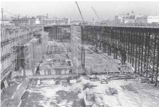
▲昭和48年、地下鉄東西線の建設工事。昭和51年6月に、琴似～白石間が開通した。