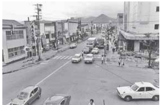
▲昭和51年、琴似2条1丁目（現在の塚本ビル5588コトニの前）の光景。