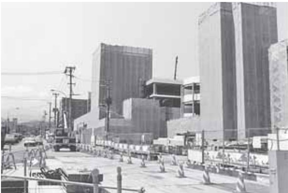
▲平成10年、宮の沢バスターミナルの建設工事。平成12年には、近隣に生涯学習総合センター(ちえりあ)が開設されている。