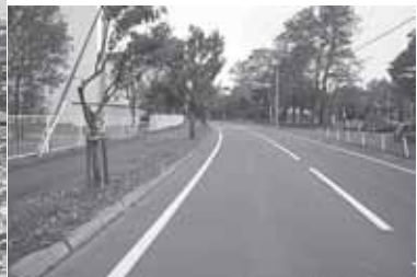
▲(左) 昭和48年、農試公園入り口付近の道路工事。まだ道路沿いの街路樹はなく、遠くの間々まで見通せる。(右) 現在の様子。