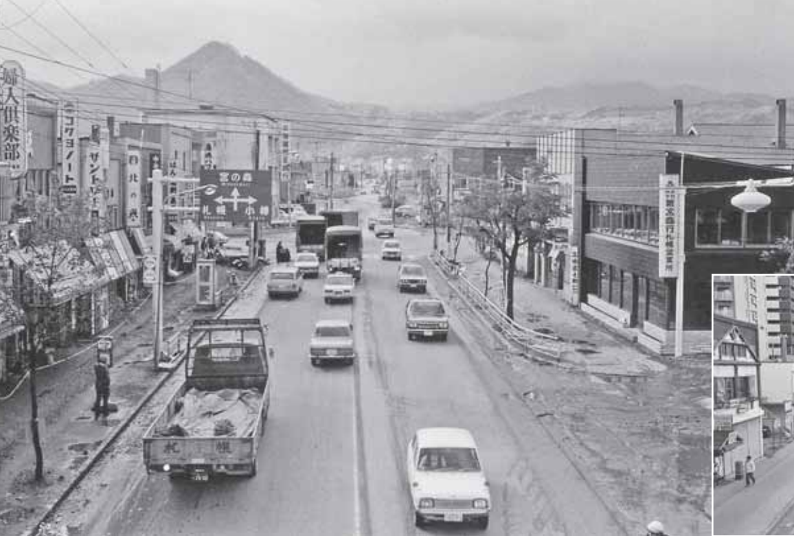
◀昭和47年、琴似1条6丁目（西区民センター前の歩道橋上）から撮影。奥に三角山の姿が見える。