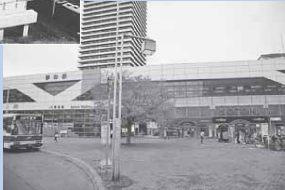
▲ (左上) 昭和47年、国鉄(現J R) 琴似駅横の踏切。(右上) 踏切があった場所の現在の様子。 (中央) 昭和61年、鉄道の高架工事。 (左下) 昭和54年、国鉄琴似駅の光景。(右下) 大きく変ぼうを遂げた、現在のJ R 琴似駅前広場。