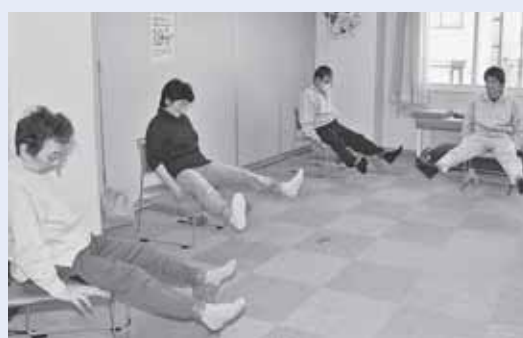
東老人福祉センター（北41東14）で実施されている「運動能力向上トレーニング教室」の様子。参加者の体力に合わせた運動方法を学べます。