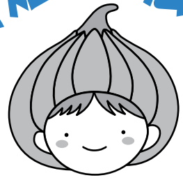
東区マスコットキャラクター「タッピー」