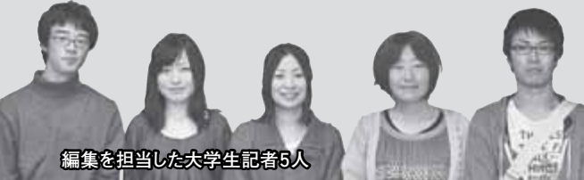
編集を担当した大学生記者5人

今月の特集は「西区PR隊大学生記者」が編集を行い、取材先の選定から、実際の取材、校正までの作業を行いました。「西区PR隊大学生記者」とは、市内の大学生が西区役所の記者となり、地域の取材や区の広報活動を行うもので、今年8月に結成されました。