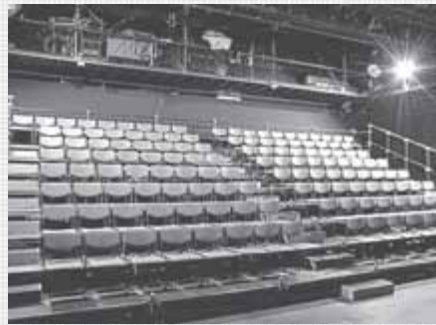
↑イナダ組は、昨年東京で行われた演劇コンクールでグランプリを受賞した札幌を代表する劇団