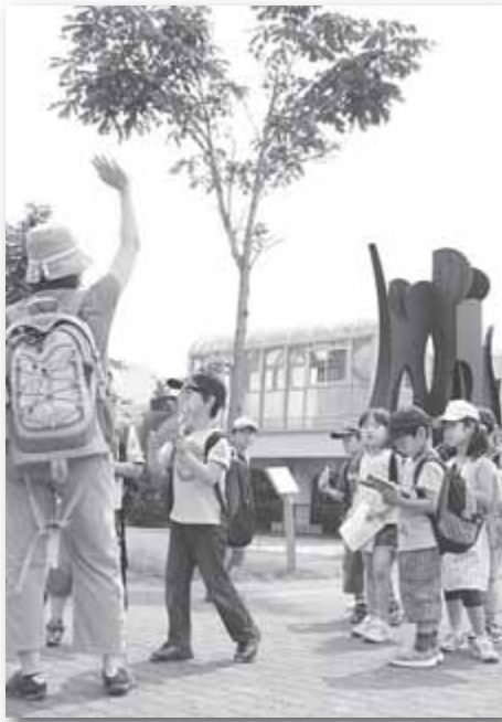
きたーくのなぞ 探検ウォークラリー