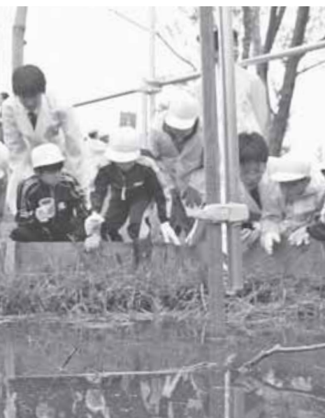
幼虫の放流を見守る理科研究部員 たち。子どもたちの自然保護の気持 ちが育つことを願っています

まちづくりやボランティアなどに参加している 地域活動の担い手をシリーズで紹介します