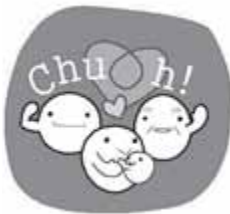
▲けんこうフェスタキャラクター