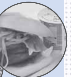
↑ 野付産の巨大ホタテを春巻きにしてはさむ「別海ジャンボホタテバーガー」