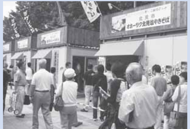
↑ 全17日間を3期に分け、入れ替わりでご当地グルメが登場

オホーツク紋別ホワイトカレーや初山別天然真ふぐ照り焼き丼など、普段は地元でしか食べられない14種類のご当地グルメが味わえるほか、道産小麦100%めんを使用したラーメン店が延べ15店舗集結します。