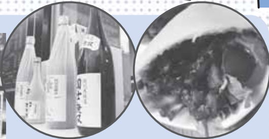
↑ 蔵元秘蔵の日本酒も用意。数量限定で提供します