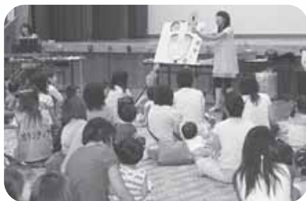
▲区民センターで行われたミックスジュースユニットの公演

ふれあいあそびや歌あそびなど、親子で一緒に楽しめる、体験型のゆかいな音楽会です。