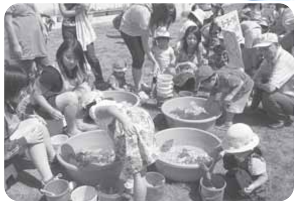
▲ボランティアの方々と遊ぶ子どもたち