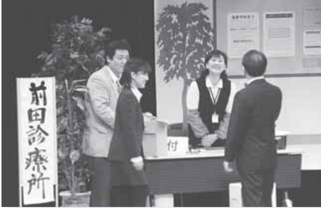
▲旗揚げ公演では事務員役として出演