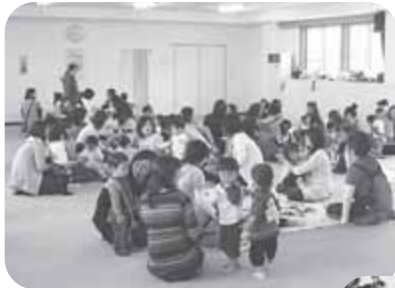
▲サロンで遊ぶ親子

地域の会館や小学校、児童会館などを会場に、子育て中の親子と地域の方たちが集い、自由に交流できる場です。サロン開催日の時間内なら、都合のいい時間帯で利用することができます。