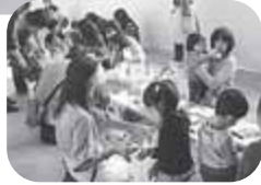
▲お母さんと一緒にお買い物

いつもチョッピリがまんしているお兄ちゃん・お姉ちゃんとの時間を楽しんであげてください。その間、赤ちゃんは私たちボランティアにお任せを♪