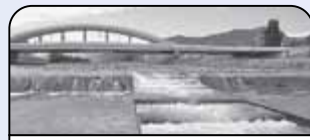
豊平川の「魚道」を整備。

豊平川さけ科学館が開館。 「カムバックサーモン運動」の高まりを受けて、サケのふ化・放流を続けるためのふ化場とサケについて学習するための施設として誕生。