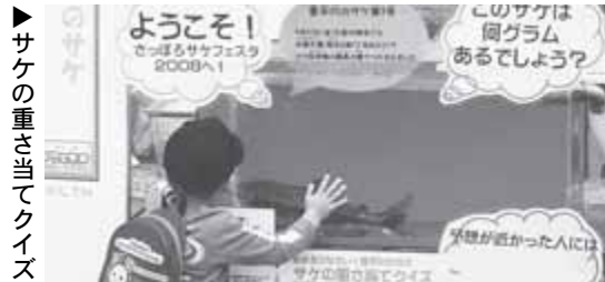
▶サケの重さ当てクイズ