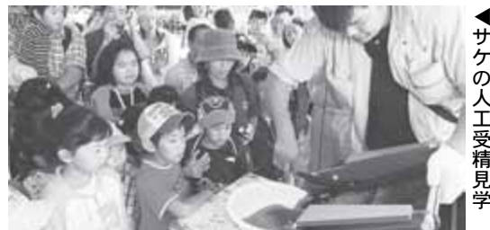
▶サケの人工受精見学