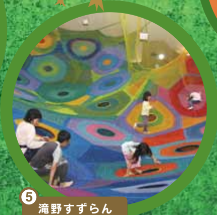
5 滝野すずらん 丘陵公園