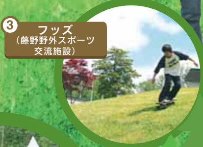
3 フッズ (藤野野外スポーツ 交流施設)