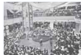
▲サンピアザオープン / 1977年

1972年(昭和47年)から新札幌駅周辺の開発が進められ、商業施設や文化施設などが多数建設された。