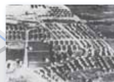
▲造成中の団地 / 1959年