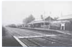
▲厚別駅 / 1921年