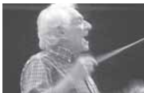
レナード・バーンスタイン(1918~1990) [PMF1990から]

PMFを創設した、20世紀を代表するアメリカの名指揮者バーンスタイン。音楽で「世界中の人と感動を分かち合い、それを受け継いでいく人々を育てたい」。そんな思いから彼は若手音楽家たちへの指導に情熱を注ぎ込み、その結果、初めてのPMFは大成功を収めます。そして、その3カ月後、彼は病のため、72年の生涯を閉じました。バーンスタインの遺志を受け継ぎ、20回目を迎えたPMF。ここで学び巣立った修了生は、2,400人を超え、世界中の有名オーケストラで活躍しています。彼の築いたPMFは、今や世界でも有数の国際教育音楽祭となり、開催地の札幌の名を世界に知らしめています。