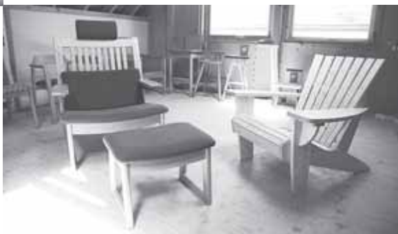
■工房の二階がショールームになっており、顧客との打ち合わせなどもここで行う。

これまでに、かでの2・7のハワイイベント、道警本部のロビー家具の制作、札幌コンサートホール「Kitara」の大・小ホール客席デザインなど、建築空間と家具の調和を意識した数多くの作品も手掛けている。