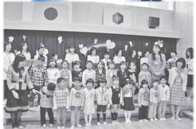
3/30(月) 札幌市立認定こども園「にじいろ」開設記念式典 市立初の認定こども園が真栄にオープン。式典では、子どもたちの元気な歌声で園歌「にじいろのこ」が披露されました。