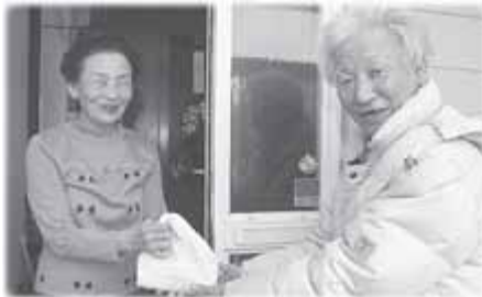
3/18(水) 福まち事業 友愛訪問

里塚・美しが丘地区福祉のまち推進センターが、一人暮らしのお年寄りへ愛情たっぷりのおはぎ弁当や防空ずきんを届けました。