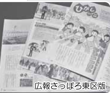
広報さっぽろ東区版

さまざまな行政情報やまちづくりに関する情報などを、より分かりやすく正確・迅速に伝えるための工夫（広報さっぽろや東区民ホームページでの広報など）に努めます。