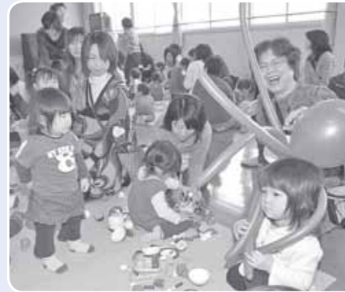
地域の子育てサロン (北栄地区 子育てサロン「つぼみ」)