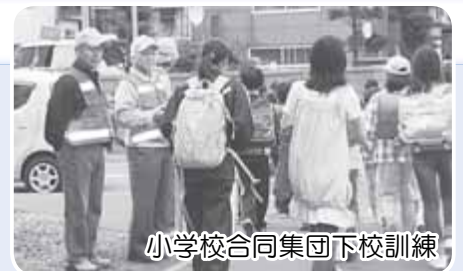
小学校合同集団下校訓練

犯罪、災害、交通事故、食の安全など、さまざまな事件や事故から、生命や財産、健康を守り、区民が安心して暮らせるまちを目指し、地域や関係団体などと協働して安心安全や健康などに関する事業に取り組みます。