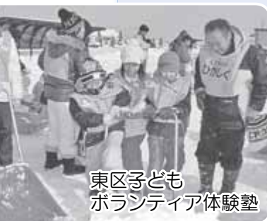
東区子どもボランティア体験塾