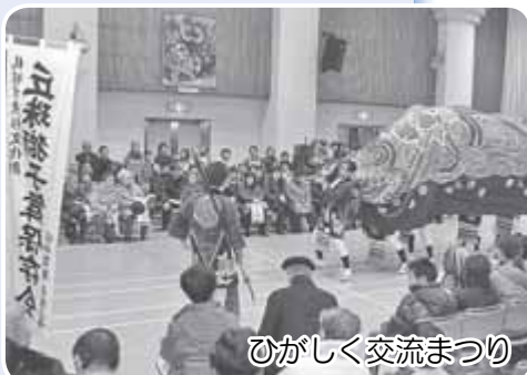
ひがしく交流まつり