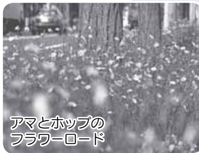
アマとホップの フラワーロード

地域に対する郷土愛やふるさと意識を醸成し、個性的で活気に満ちたまちを目指し、地域固有の優れた郷土文化や歴史的・文化的資源を生かした事業に取り組みます。