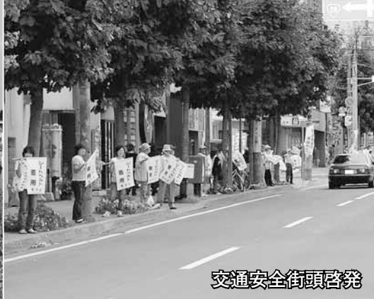
交通安全街頭啓発