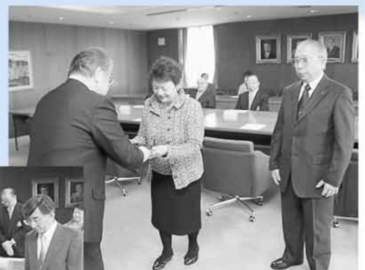
▲一人暮らしの高齢者等の見守りや福祉バザー、「生き生き茶話会」などを実施している「丸山すずらの会」