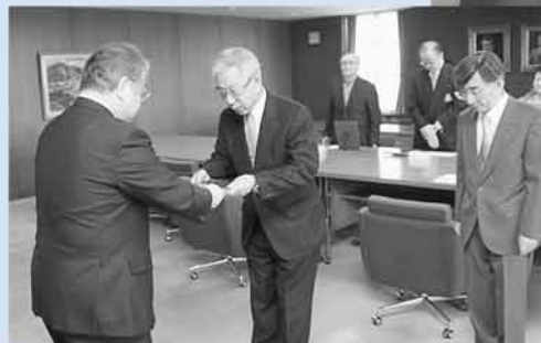
▲ウォーキング活動を40年の長きにわたり実施している「手稲早起き一万歩あるく会」