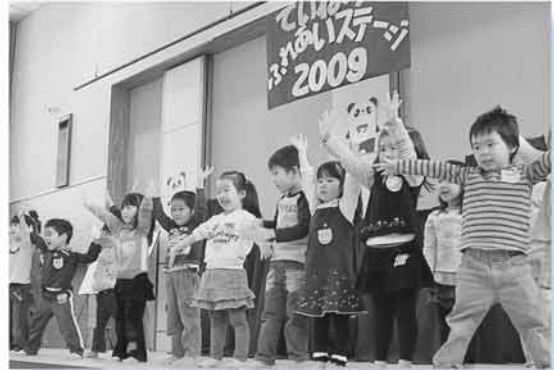
▲体操では日ごろの成果を体いっぱい披露しました