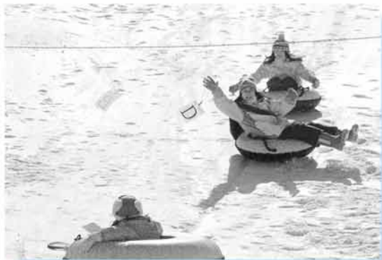
▲チューブに乗って滑りながらカードを手にします

手稲の冬の風物詩となった「手稲山雪の祭典」が今年も行われ、冬ならではの遊びに多くの親子連れが参加しました。