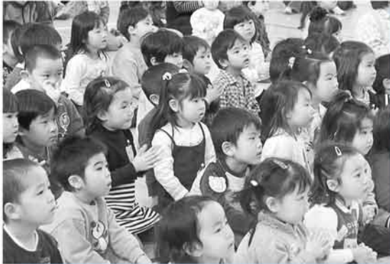
▲子どもたちは、ステージの発表に目を奪われて真剣

手稲区保育・子育て支援センター（ちあふる・ていね）の主催で子育てサロンの親子や園児、地域のボランティアらが一緒に出し物や体操を楽しい時を過ごしました。