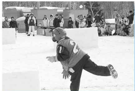
▲掛け声が飛び交う迫力満点の子ども雪合戦