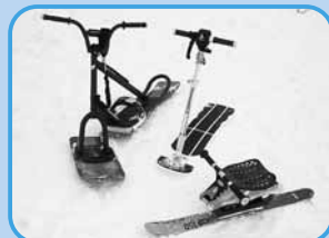
左からスノースクート、スノープル、ポッカール