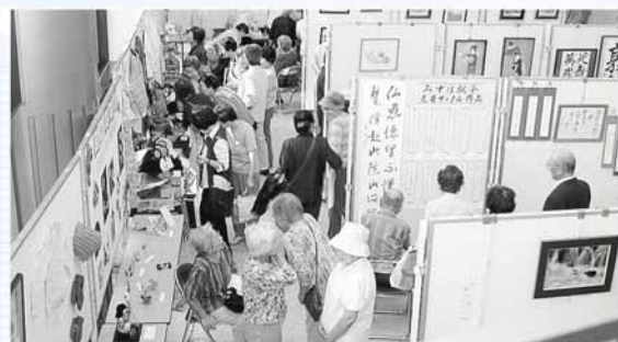
▲「文化作品展示会」の様子