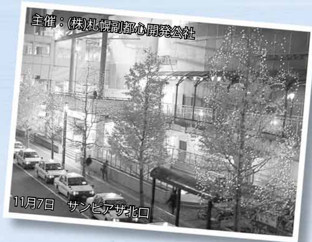
主催：(株)札幌副都心開発公社

17本のイチョウ並木に36,000個の電飾が付けられ、11月7日からイルミネーションの点灯が始まりました。