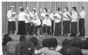
▲「交歓演芸大会」の様子

毎年、厚別区民まつりに協賛して行う「ノミの市」、趣味や創作活動を公開する「文化作品展示会」、日ごろのサークル活動で鍛錬してきた芸を披露する「交歓演芸大会」などの活動を広く区民に向けて行っているほか、健康増進、ボランティア、