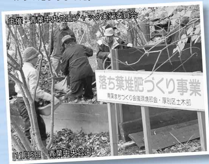
主催：青葉中央公園ジャック実行委員会

今年も、来年の花壇作りに向けての堆肥まきが終わり、公園内の落ち葉を利用した、新たな堆肥作りが始まりました。