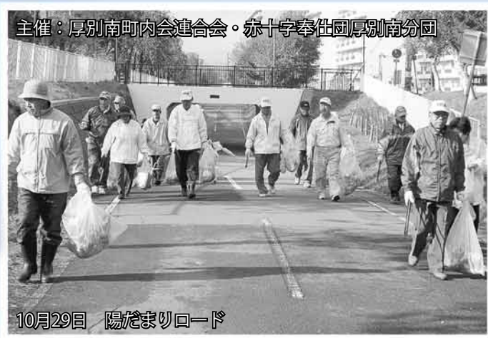
主催：厚別南町内会連合会・赤十字奉仕団厚別南分団

冷たい風が吹く中、たくさんの地域の人たちが参加して、今年2回目のごみ拾いが行われました。