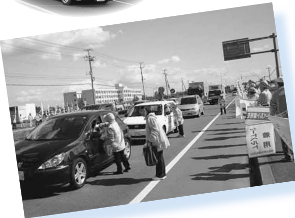
▲停止した車に、交通安全の啓発品を手渡します。