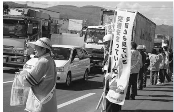
▲交通安全の旗を掲げ事故防止を呼びかけました。