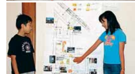
安全マップと発表の様子