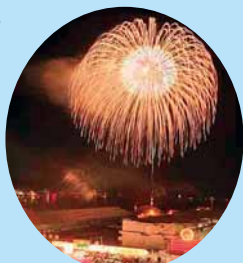
▲最終日の花火大会