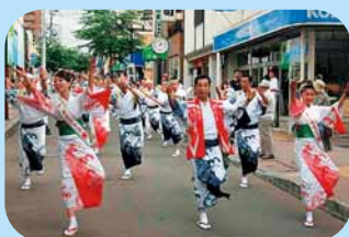
▲「潮ねりこみ」の様子

7月25日の「潮ふれこみ」に始まり、翌26日にはメインの「潮ねりこみ」、最終日の27日には「花火大会」が予定されています。