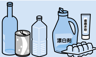
びん・缶・ペットボトル 容器包装プラスチック

「びん・缶・ペットボトル」「容器包装プラスチック」などの資源物は、手数料が掛かりません。これまで通り、透明か半透明の袋を使用してください。