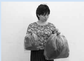
5リットル(左)と20リットル(右)のごみ袋