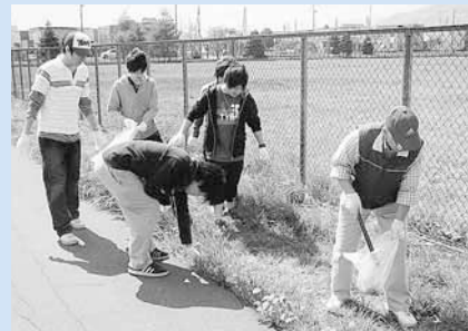
▲地域の方々と協力しての活動で、交流を図るきっかけになりました