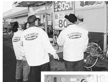
◀皆さんの身近な場所でパトロールしています

下校時の通学路をはじめ、公園や暗い夜道など危険と思われる場所やイベントの開催時などに、見回りをしながら子どもたちに優しく声をかけるなど、子どもたちが安全で安心して暮らせる環境づくりに努めています。