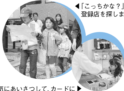
◀「こっちな？」地図を見ながら登録店を探します

手稲地区で、「青少年を見守る店」スタンプラリーが行われました。登録店のスタンプを集めることを通して、通学路にある見守る店を子どもたちに知ってもらおうと手稲地区青少年育成委員会が企画したものです。