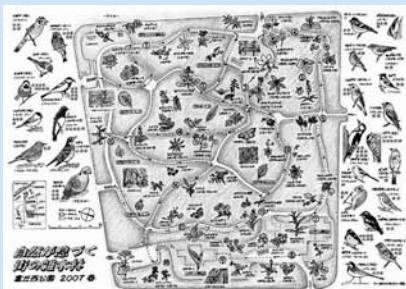
▲環境大臣賞を受賞した作品