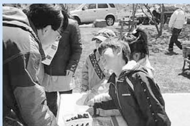
▲さまざまなイベントが行われ、春の一日を楽しみました