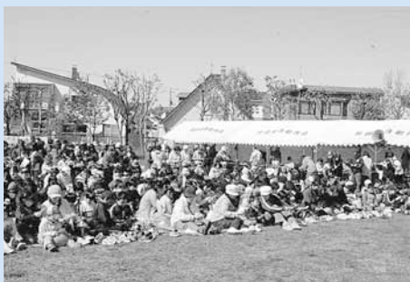
▲今年もたくさんの方が参加しました