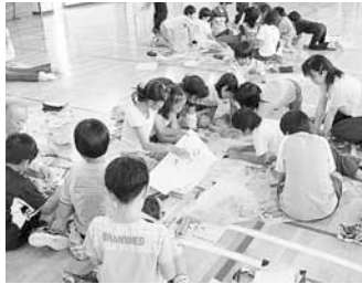
▲「いろいろ危険な場所があるんだな」と感想を話していました

手稲西小学校で「セーフティマップ」(地域安全マップ)作りが行われました。通学路や公園などを中心に犯罪が起こりそうな場所を探しに出掛け、メモを取り、写真を撮影して地図を作りました。