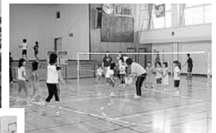
▲富丘小学校と西宮の沢小学校でバレーボールの指導をしています