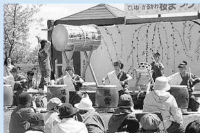
▲風雪太鼓の勇壮な演奏で会場を盛り上げました