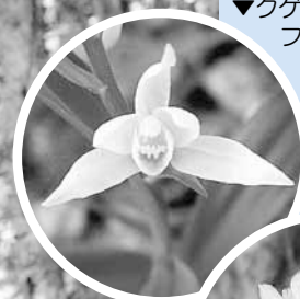
▼クゲヌマラン(上)とフデリンドウ(下)の可憐な花