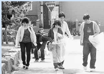
▲学生達もグループで道路わきのごみ拾いを行いました