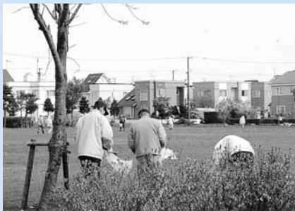
▲前田西公園での清掃活動

ゴールデンウィーク最終日、北海道工業大学の学生と、近隣の7町内会が協力してごみ拾いが行われました。