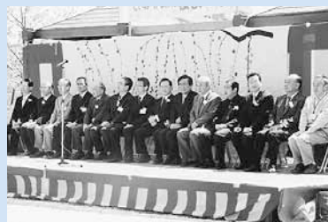
▲大勢の来賓も見られました