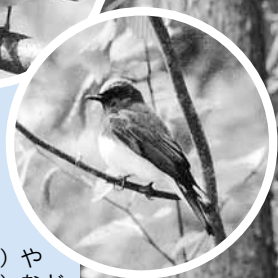
▲キビタキ(上)やオオルリ(下)などさまざまな野鳥も姿を見せます