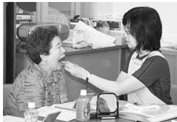
▲お口の健康をしっかりとチェック