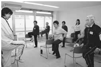
▲休憩と楽しいおしゃべりを交え、しっかり運動