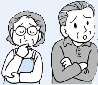
篠路地区にお住まいのCさんご夫婦