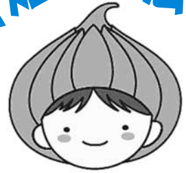
東区マスコットキャラクター「タッピー」