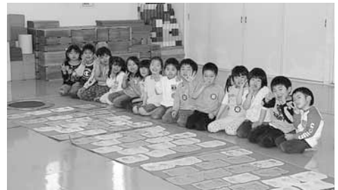
こいのぼりと一緒に、はい、チーズ