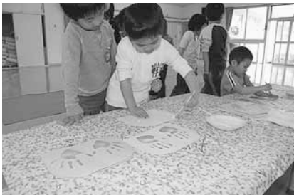
うろこにのりを塗っているところです