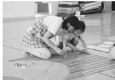
まっすぐ張れるかな