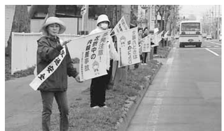
真剣な表情で安全運転を呼び掛けます