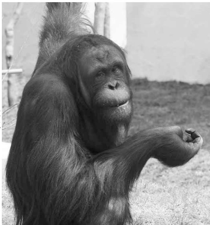
▶「類人猿館」のオランウータン「弟路郎」