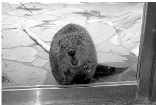
▶「こども動物園内」ビーバーの森「のビーバー」

長かった北海道の冬が終わり、これから屋外に出掛ける機会が多くなる季節になってきました。