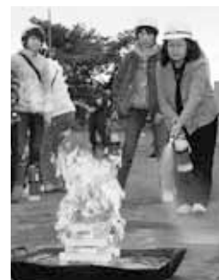
▲地域での防災訓練の様子

また、区民の皆さんや防災関係機関と連携し組織的な防災力の向上を図るため、大規模な自然災害を想定した「白石区防災訓練」や地域での防災活動の中心となる人材の育成を目的とした「防災リーダー研修」を実施します。