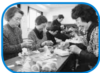
▲マスコット作りの様子

また、この日は、白石区老人クラブ連合会女性部からも交通安全を祈願して手作りしたマスコットがプレゼントされました。