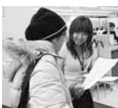
▲来庁者アンケートの様子