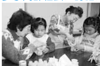
▲子育てサロンの様子