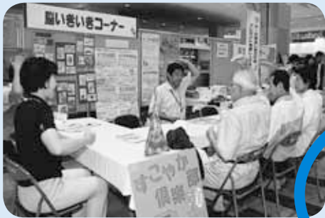
▲「介護予防フェア」での出前すこやか倶楽部

子どもからお年寄りまで誰もが健やかに暮らしていけるよう、さまざまな情報発信の場を設け、地域での活動が充実するよう応援していきます。