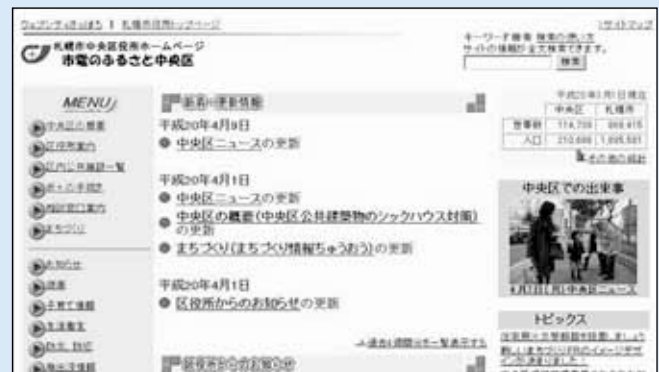
▲情報を提供する中央区役所ホームページ ( http://www.city.sapporo.jp/chuo/ )

市民自治には、区民の皆さんとの情報共有が大切です。区役所からの情報はわかりやすく発信するよう工夫していきます。