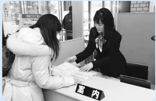
▲3～4月の区役所混雑期における案内役の設置

すべての職員が仕事の知識や接客力を高め、また、民間のノウハウを活用してさらなるサービスアップを図ります。