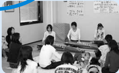
▲「大通地区子育てサロン」お琴の演奏会

未来を担う子どもたちが心豊かで健やかに育っていくよう地域や学校との連携を深めていきます。