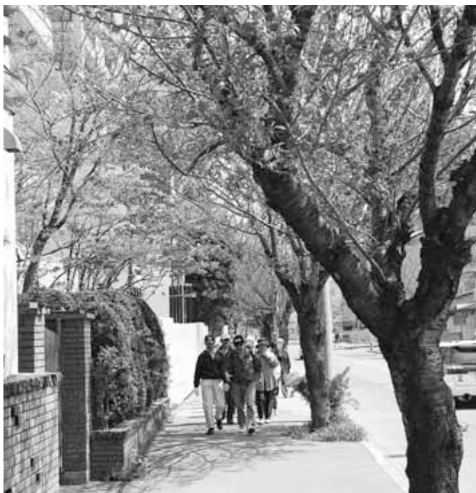
▶ 中央区健康づくり元気会「お花見ウォーキング」