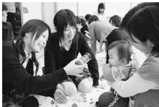
▶ 次世代育成支援事業 「赤ちゃんつてすごい」