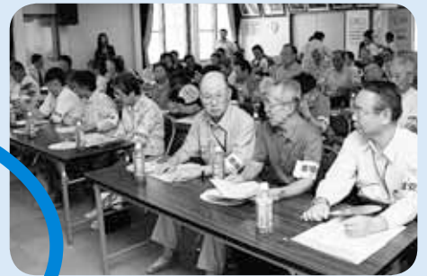
▲曙地区「歩こう会」地域防犯活動発足式

区民の皆さんが、安全で安心して暮らせるよう関係機関との連携、適切な情報発信、地域活動への支援など総合的な取り組みを進めていきます。