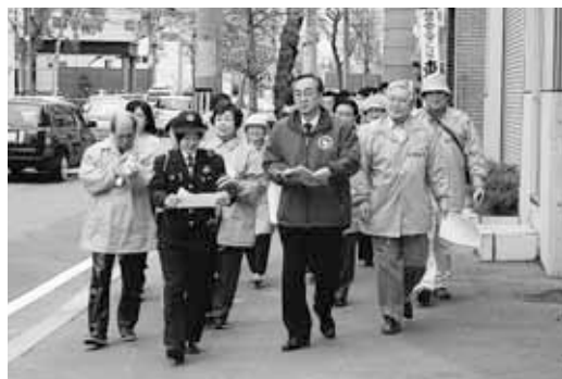
▶ 東北地区 「防災・防犯パトロール」

札幌市では、市民が満足する市政運営を実現するため、局・区ごとに「局区実施プラン」を策定しており、中央区の「ふれあいプラン・ちゅうおう」は、市民自治が息づくまち「中央区」を目指して、区役所の使命や運営方針を定め、その具体的な取り組みについて掲げたものです。