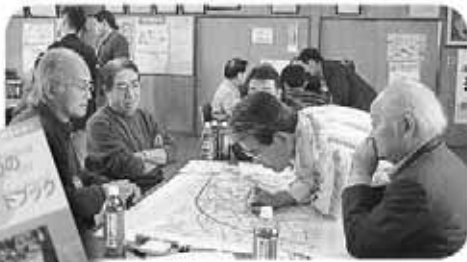
防災行動ガイドブックを活用した災害図上訓練(DIG)の実施