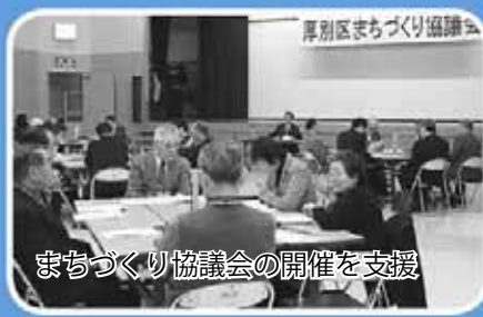
まちづくり協議会の開催を支援