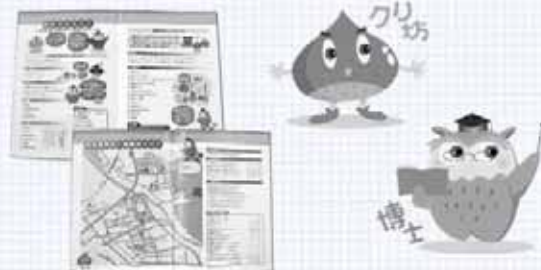
▲くりの木公園のクリ坊、野幌森林公園のフクロウ博士と、厚別東地区にちなんだキャラクターが登場。

つひがし わが家の防災入門ガイド(地震編)』を作製し、全戸に配布しました。災害に対する普段からの心構え、非常持出品のチェックリスト、避難所の地図など、6人の編集委員が使いやすさを考えて作りました。また、厚別東地区で行われている防災活動の情報も紹介しています。