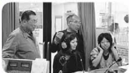
広報ラジオ番組で区民ゲストがまちづくり活動を紹介

このページに関するお問い合わせは、厚別区役所市民部総務企画課 ☎895-2400（内線 212）