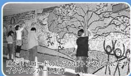
陽だまりロードのしらかばトンネル内にモザイクタイルアート制作

青葉町3丁目のD5、6号棟（平成20年12月まで）、D7号棟（平成21年10月まで）に続き、青葉町6丁目のE1、2、6号棟（平成20年から）の建て替えを行います。