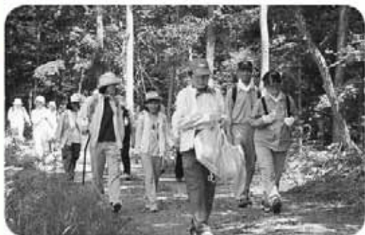
3市交流事業ファミリー森林浴ウォーキング