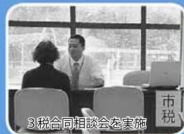
3税合同相談会を実施