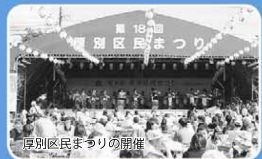
厚別区民まつりの開催