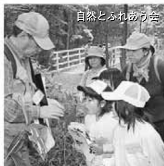
自然とふれあう会