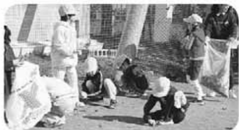
まちづくり協議会企画の「☆10(ピカッとスタート)あつべつゴミ拾い月間」