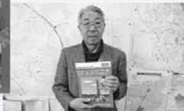
▲子どもからお年寄りまで読みやすいように、字が大きく、内容が簡潔にまとまっている。