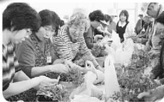
花と緑のふれあい事業ガーデニングバスツアー