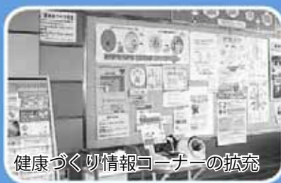
健康づくり情報コーナーの拡充