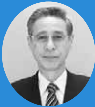
厚別区長 なかむら しゅうせい 中村 修三

HP http://www.city.sapporo.jp/atsubetsu/