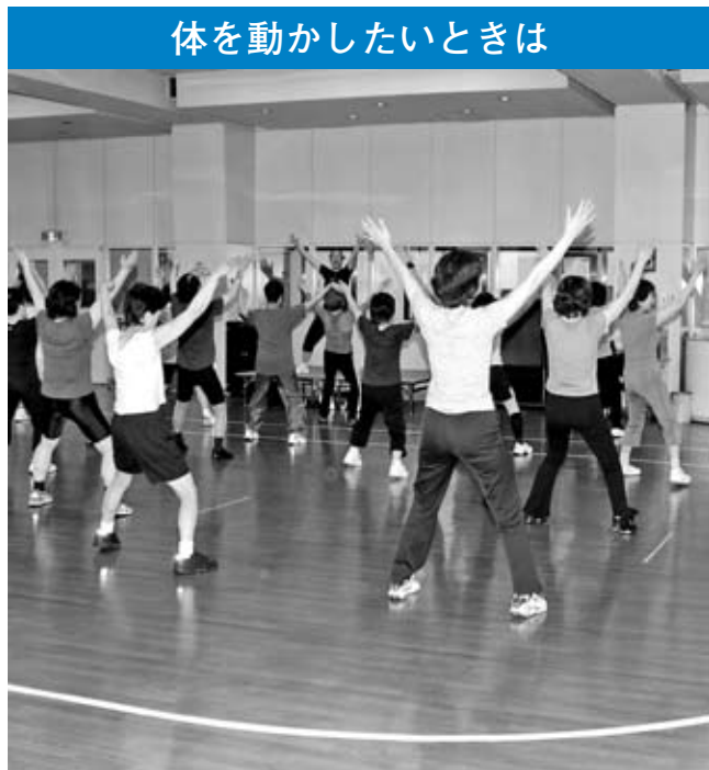
体を動かしたいときは

区内にはどなたでも利用できる便利な施設がたくさんあるのをご存じですか？ 目的ごとに使い分けて、生活にお役立ててください。