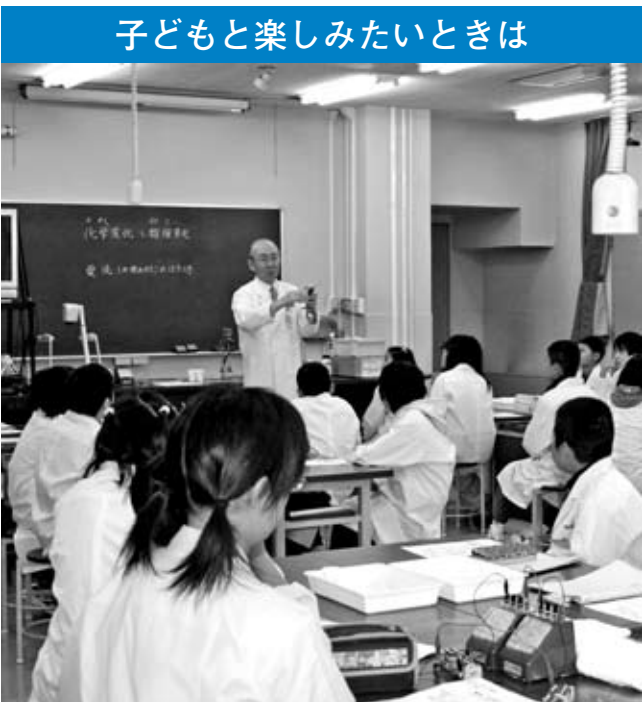
子どもと楽しみたいときは