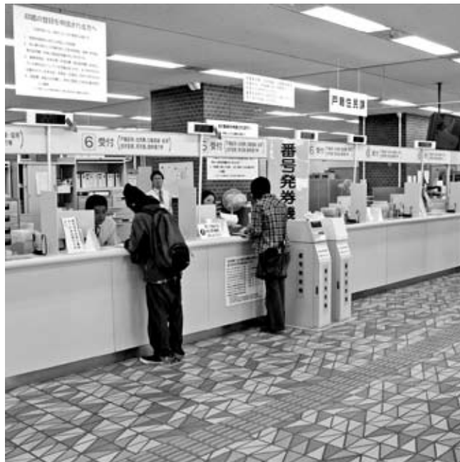
区役所に用事のあるときは