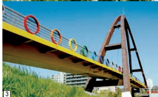
2 環状通に架かる「環状夢の橋」。6月下旬から見ごろを迎える環状通沿いのバラが見下ろせます。3 厚別川に架かる「虹の橋」。七色の輪は虹をイメージしてデザインされました。

今では、サイクリングやジョギング、散歩などを楽しむ多くの人が行き交う、区民の憩いの場となっています。