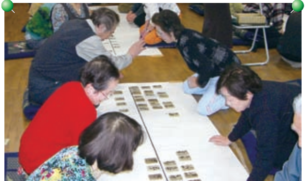
▶ 中央区老人クラブ連合会主催「新春カルタ大会」