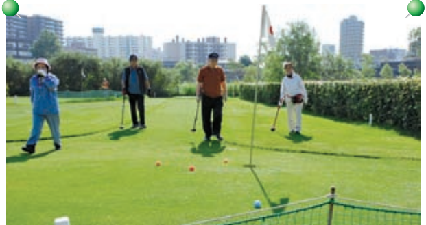
▶ 中央区老人クラブ連合会主催「パークゴルフ大会」