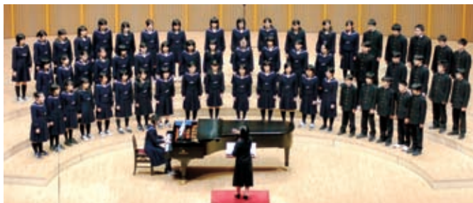
◀ 向陵中学校の合唱

第2部は、東京を拠点に活動している「東京 ブラススタイル」が「風の谷のナウシカ」など のアニメ音楽をジャズやラテン調にアレンジし て演奏し、会場を沸かせました。