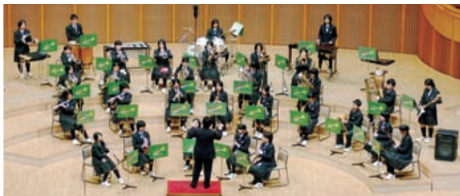
◀ 伏見中学校ブラスバンド