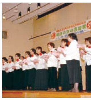
▲「曙ほのぼの芸能祭」の様子

曙地区は、中島公園の西側に位置し、南北は南八条から南十四条行啓通まで、東西は鴨々川から西二十二丁目までの比較的コンパクトな地域に、人口一万二千四百六十八人が生活する市内では同じ中央区の西地区に次いで二番目の人口密集地区です。 地区のまちづくり活動は、曙地区連合町内会をはじめとした各種団体により多様な取り組みが進められています。この地区を特徴づけるのが「健康づくり」と「芸術・文化」に関する活動です。 『健康づくり』では、連町主催の「健康づくり教室」や「健康づくり登山会」をはじめ、「曙歩こう会」による「ウォーキング活動」や「冬の健康体操」など、一年を通じた地域住民の健康づくりを進めており、特に「ウォーキング活動」では、本年度から共通