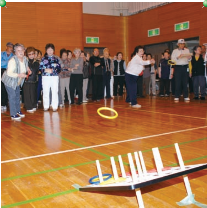
▶ 中央区老人クラブ連合会主催「輪投げ大会」