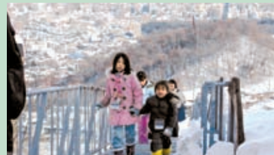
▲「いい眺めだけど階段ツライ」