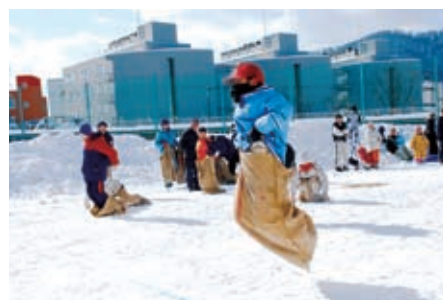
▲ゴールまであと少し

晴天に恵まれたこの日は、「みかん拾い」や「ピン釣り競争」、大 きな布製の袋に両足を入れ、飛び跳ねながらゴールを目指す「だる まさんがんばれ」などの競技が行われ、会場は大きな歓声に包まれ ていました。