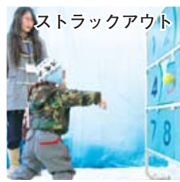
ストラックアウト

区民が企画から運営まで行った、冬の手作りイベント。2日間で延べ2万5千人が訪れ、会場は親子連れなどでにぎわいました。(2月2日、3日)