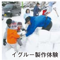
イグルー製作体験

ファミリーフェスタ (区民センター) 木の砂場、リラックスコーナー、あそびのコーナーなどに、たくさんの親子連れが訪れました。