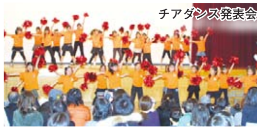
チアダンス発表会