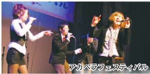
アカペラフェスティバル