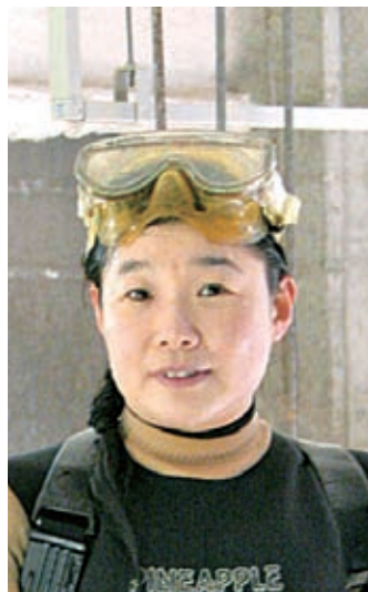
サンピアザ水族館 マリンガール