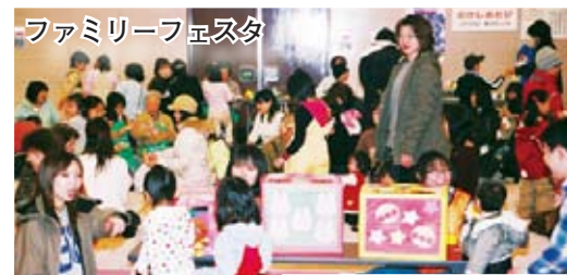
ファミリーフェスタ

ファミリーフェスタ (区民センター) 木の砂場、リラックスコーナー、あそびのコーナーなどに、たくさんの親子連れが訪れました。