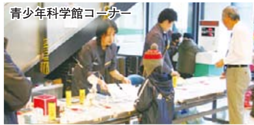
青少年科学館コーナー

アカペラフェスティバル (サンピアザ劇場) 道内で活動する20組のアカペラグループが、見事な声のハーモニーを披露しました。