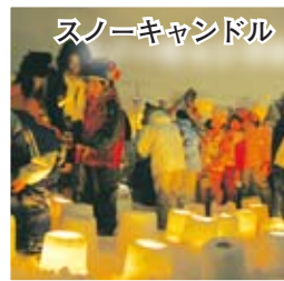
スノーキャンドル