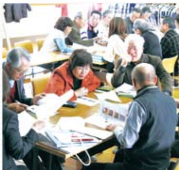
実行委員会の様子。25人の地域住民が運営を担当。

毎年、和太鼓、舞踊、コーラス、南京玉すだれなど、さまざまな演目でにぎわいます。今年も、北星学園大学チアダンス部の指導による子どもたちのチアダンスが加わり、二十二演目に百五十人が出演