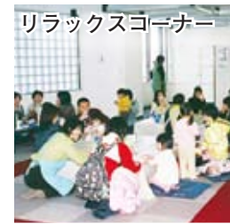
リラックスコーナー