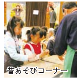
昔あそびコーナー