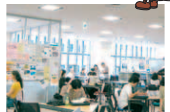
誰でも使用できる打ち合わせコーナー

開館時間 午前8時45分～午後10時 相談日時 火曜～土曜 午後2時30分～7時 住所 北区北8西3 エルプラザ2階 ☎728-5888 ホームページアドレス www.shimin.sl-plaza.jp