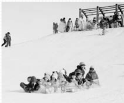
熊の沢公園の地形を生かした長さ10メートル以上もある「そりすべりコーナー」。

熊の沢公園で行われる「ワイワイ冬フェスタ」は、家に閉じこもりがちな冬に、幅広い世代の人たちが雪遊びを通して楽しく交流する行事です。企画・運営を担うのは、地域住民や学生ボランティアなどで構成する「ワイワイ冬フェスタinもみじ台実行委員会」です。