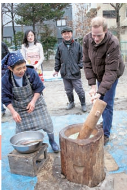
幌北第7町内会 もちつき大会