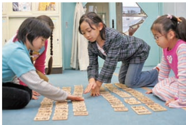
11月30日 幌北児童会館 目指せ、かるた名人！