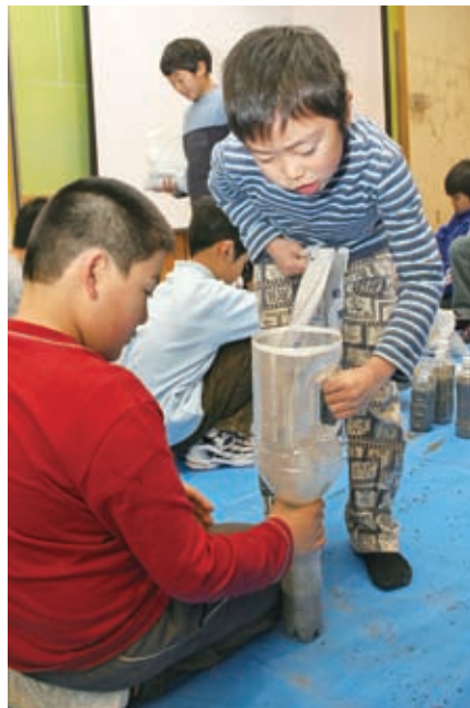
雪道の砂まき用 ペットボトル作り