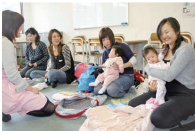
12月5日 北区民センター 新米ママが楽しく交流