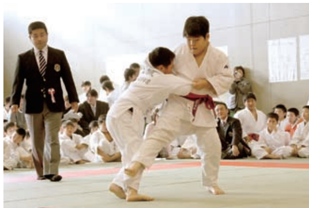
12月9日 篠路コミュニティセンター 日ごろのけいこの成果を発揮