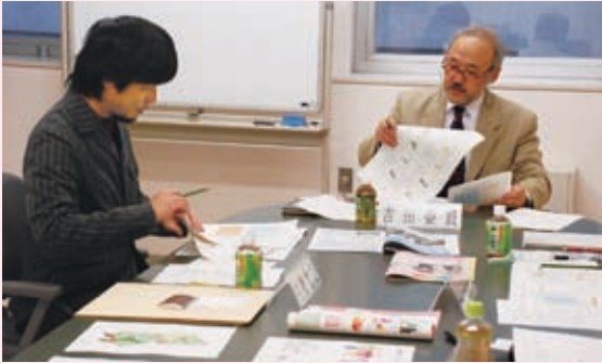
▲多数の作品から絞り込み