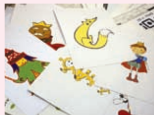
▲いろいろなデザインの作品がありました

◆全体の講評 デザインを制作。中央区は他の区よりも区をイメージさせる要素が多いので、作り手としては難しい課題だったと思います。学生の作品を見ると、洗練されている、元気で明るいという共通のイメージを元にして作ることができました。