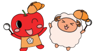
▲豊平区マスコットキャラクター「こりん(左)と「めーたん」(右)