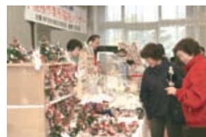
▲昨年のバザーの様子