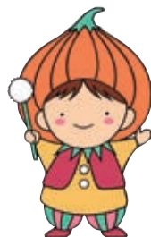
▲東区マスコットキャラクター「タッピー」