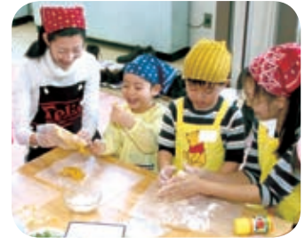
▲今年行われた「幼児料理教室」