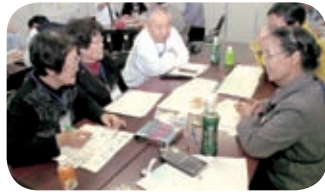
▲「まちづくり善俗堂」の様子

まちづくりに関する基本的な考え方やさまざまな意見の引き出し方などについて、実践を通して学びます。