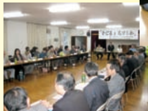
▼子どもを見守る会