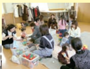
▲ごまちゃんサロン

私も里塚・美しが丘地区町内会連合会は、このたびの十周年を一つの区切りとして新たな一歩を踏み出したわけですが、今後も清田区役所や北野、清田中央、平岡、清田の各地区町内会連合会と連携を保ちながら、地域の発展および安心で安全に暮らせる環境づくりを進めてまいります。最後に、地域の町内会および町内会連合会の活動は、地域住民の皆さん一人一人のご理解とご協力が必要であります。各種活動にできるだけ参加していただき、住んで良かったと言える地域を皆さんと一緒につくってまいりたいと思います。