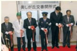
▲美しが丘交番開所式