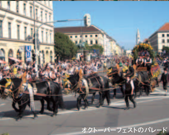
オクトーバーフェストのパレード